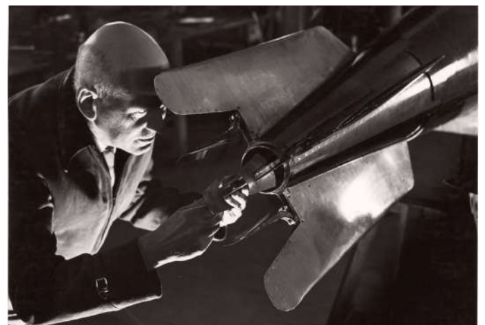
Robert Goddard, pionnier de l'astronautique, dans son atelier de Roswell | Nouveau-Mexique | États-Unis | 1940

Treasures of the Earth : sur les minéraux et pierres précieuses.