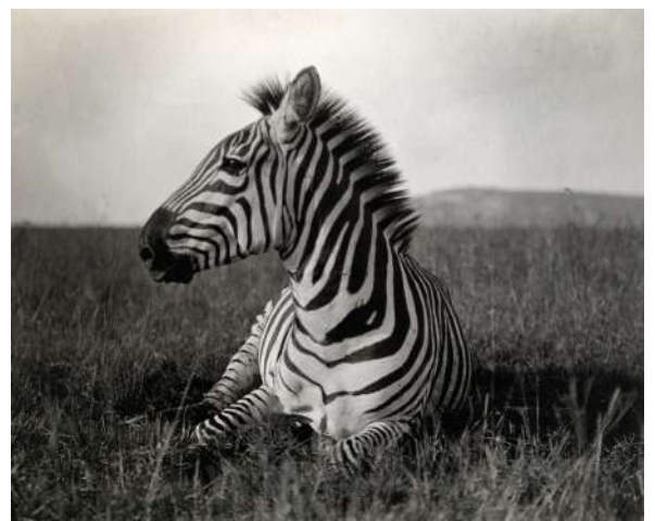
Carl E. Akeley | Zèbre | Kenya | vers 1910