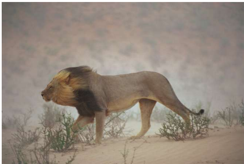
Chris Johns | Lion | Afrique du Sud | 2001