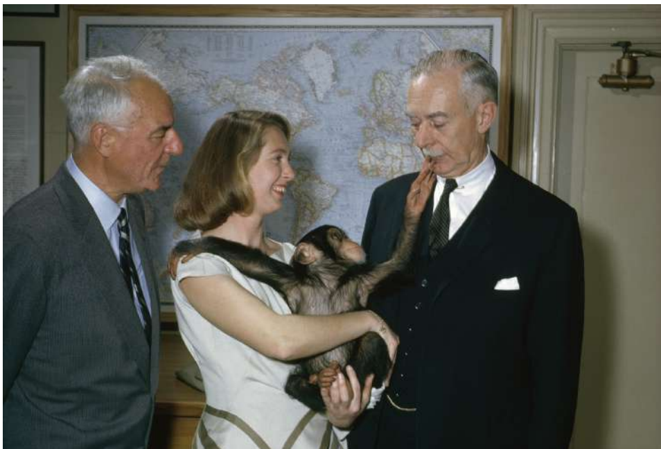
Washington, D.C. | 1962