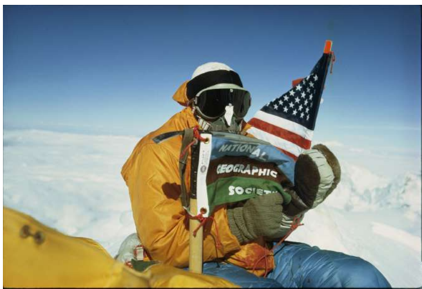
Luther Jerstad | Au sommet de l'Everest, Barry Bishop déploie le drapeau de la National Geographic Society au bout d'un piolet | Népal | 1963

Cette exposition va permettre de voyager dans le temps comme dans l'espace, d'approcher des animaux sauvages, marcher dans les jungles inaccessibles, atteindre les pôles, d'aller à la rencontre de mondes disparus, de vivre de grandes épopées, de découvrir ou redécouvrir le monde qui nous entoure. Quel beau voyage !