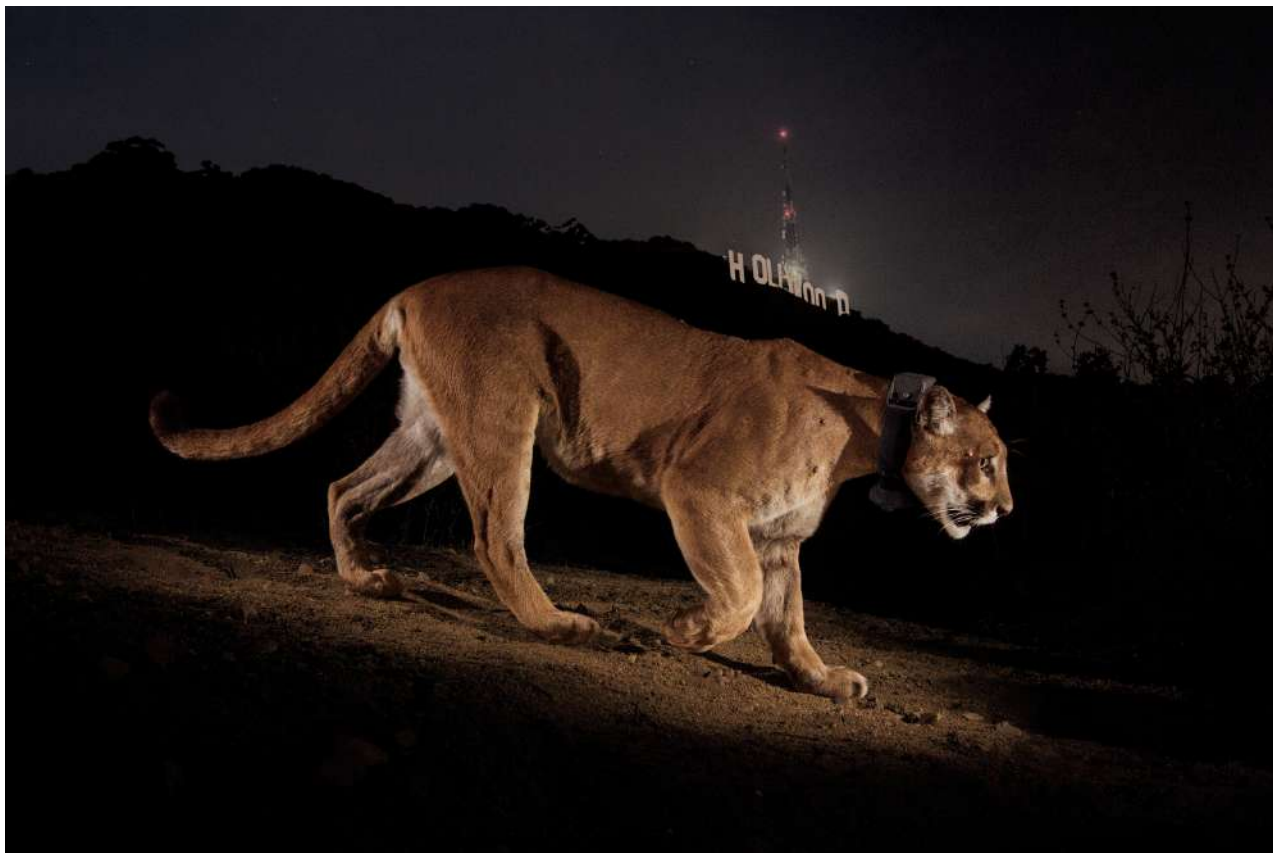
Steve Winter | Un puma mâle, capté par une caméra cachée, à Los Angeles | États-Unis | 2013

À côté des récits, les grands reportages photo s'imposent rapidement comme une marque de fabrique du magazine. À force d'invention, de patience et d'audace, les photographes de National Geographic vont nous montrer les beautés et les secrets de la nature comme on ne les avait jamais vus et « leurs photographies donnent une dimension extraordinaire aux récits des expéditeurs », comme le souligne à nouveau Jean-Pierre Vrignaud, « comme le cadre jaune qui entoure notre couverture devient une fenêtre magique sur le monde ».