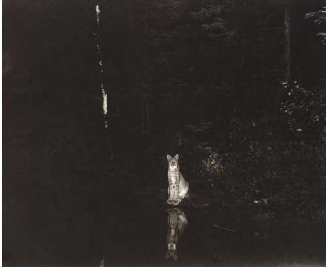
Georges Shiras | Un lynx surpris par la technique du jacklighting | Ontario, Canada | juillet 1902

En Afrique, en Chine, en Égypte, en Amérique centrale, les explorateurs de National Geographic fouillent à la recherche des traces laissées par l'humanité.